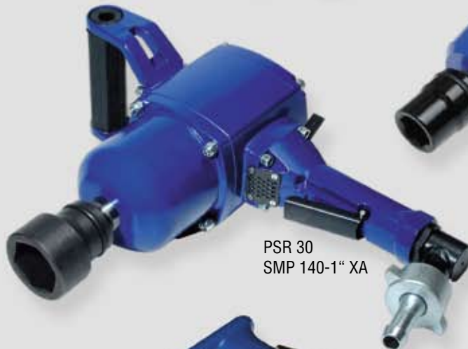
PSR 30 SMP 140-1" XA