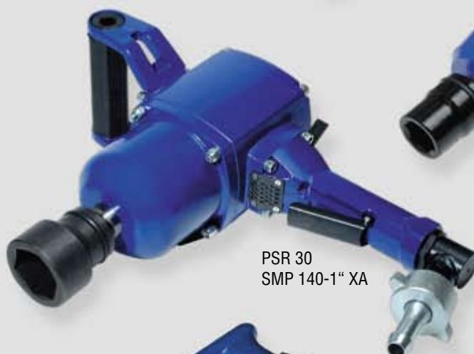
PSR 30 SMP 140-1" XA