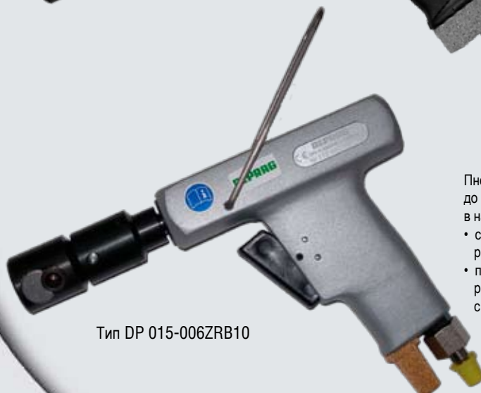
Тип DP 015-006ZRB10

Пневматические резьбонарезные машинки DEPRAG INDUSTRIAL до М 16 для производительности резания стали до М 16 имеют в наличии 2 вида резьбонарезных машинок: