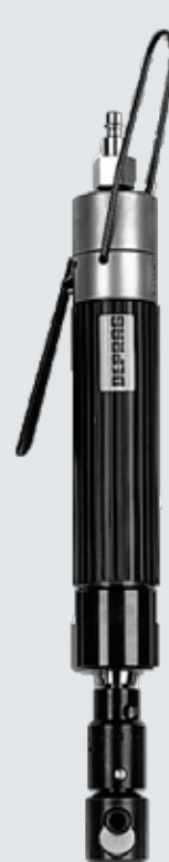
Тип DS 040-007BXR12