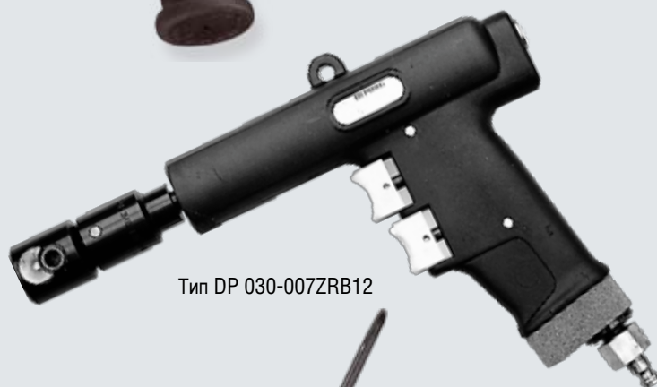
Тип DP 030-007ZRB12