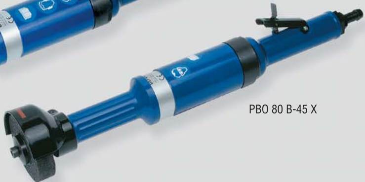
PBO 80 B-45 X