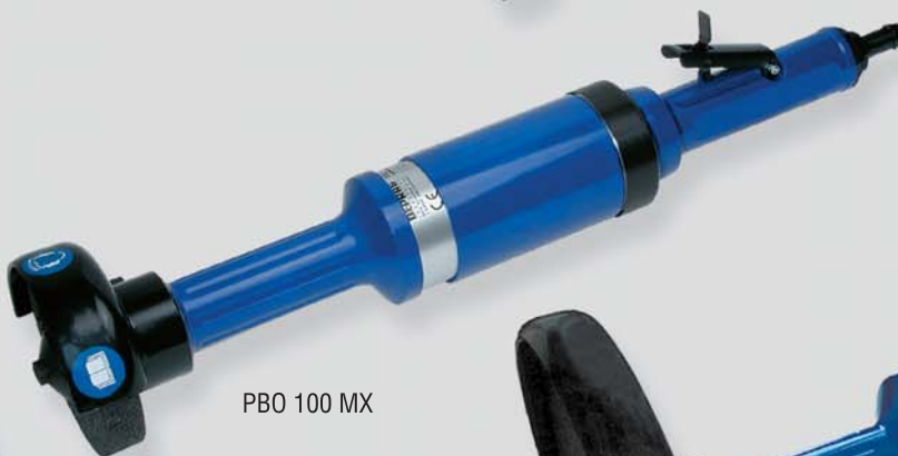
PBO 100 MX