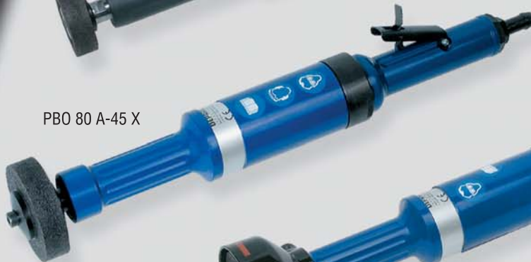
PBO 80 A-45 X