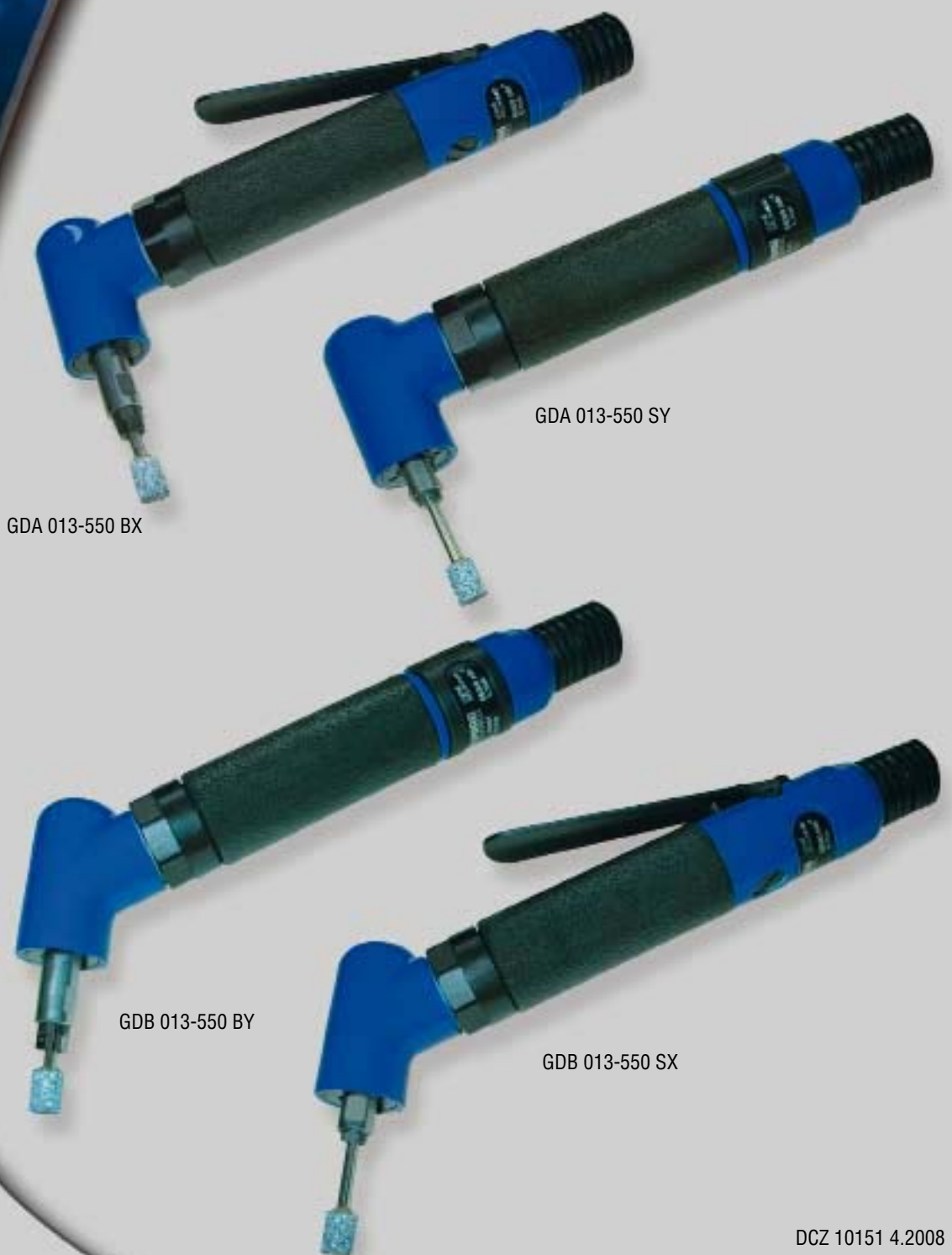
GDA 013-550 BX

Výkon / Power / Leistung: 0,13 kW (.17 HP)