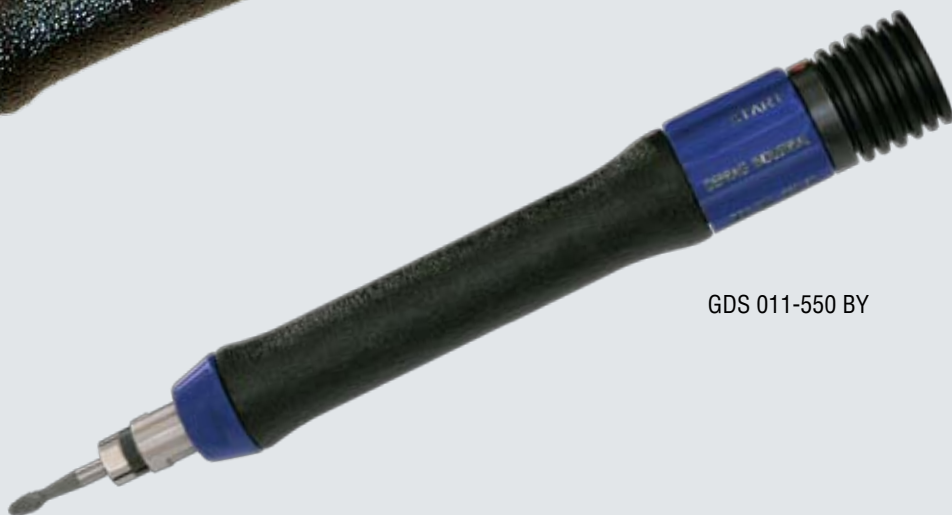
GDS 011-550 BY