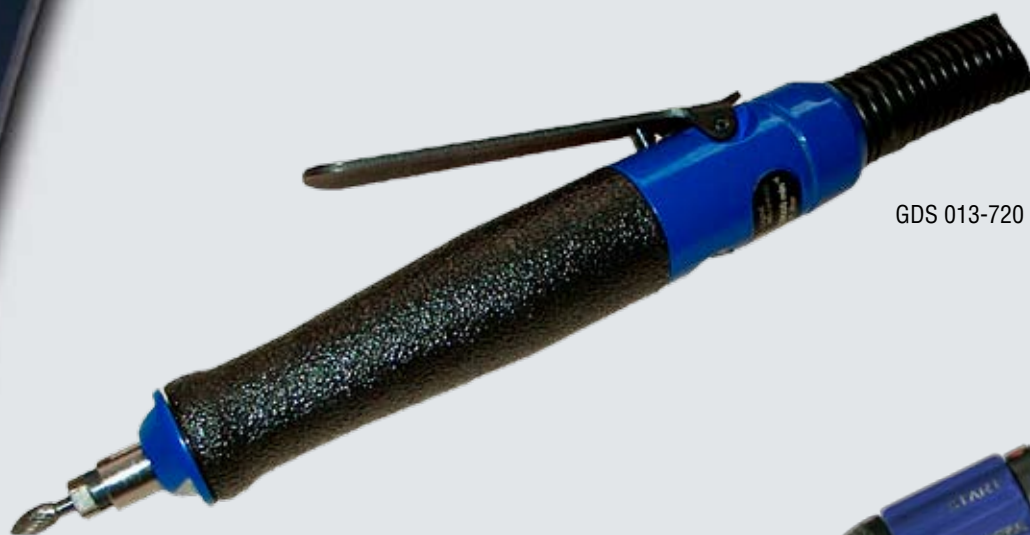
GDS 013-720 BX