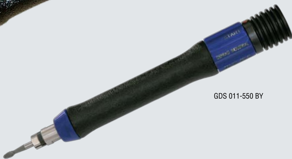
GDS 011-550 BY